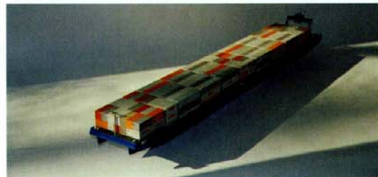
Abb. 1: Gesamtansicht Futura Carrier- 135 m-Container Binnenschiff (Modell)

dem gegebenen Binnenwasserstraßennetz in Europa hat zum Entwurf einer speziell auf diese Bedingungen abgestimmten Rumpfgeometrie des Futura Carriers geführt – mehr Breite statt Tiefgang und Länge. Das bedeutet, die Container werden in nur zwei Lagen an Deck gestaut, bei gleichzeitig höherer Verdrängung und geringerem Tiefgang. Um diesen Lösungsweg technisch umzusetzen, wurde die Antriebsleistung auf vier Einheiten aufgeteilt, von denen jeweils zwei Einheiten vorn und hinten angeordnet sind. Bei einem breiten Schiff in Flachwasserfahrt ist allerdings die Zuführung des Wassers zum Propeller sehr schwierig und muss in der Geometrie des Rumpfes berücksichtigt werden. Darüber hinaus muss gewährleistet sein, dass die Energie der beiden vorderen Antriebe nicht durch die Reibung des Propellerstrahls am