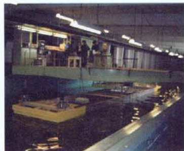
Abb. 5: Versuche bei der SVA Potsdam

Die Schlepp- und Propulsionsversuche in Potsdam zeigten, dass das Schiff aufgrund der Bugform, der Luftschmierung, der Anordnung der vier Antriebe, je zwei vorne und hinten, gegenüber dem Binnenschiff mit herkömmlicher Rumpfform und ausschließlich achterlichem Antrieb, neben der sehr hohen Manövrierfähigkeit und Betriebssicherheit, einen erheblichen Leistungs- bzw. Kostenvorteil hat. Die Auswertung der konkreten Messergebnisse lassen Prognosen auf eine Energieeinsparung von bis zu 35 Prozent im Flachwasser (ohne Luftschmierung) im Vergleich zu einem