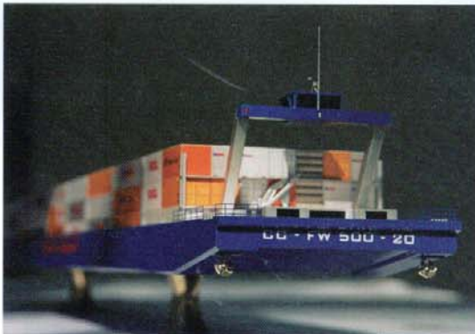
Abb. 2: Ansicht Futura Carrier- 135 m-Container Binnenschiff von vorn