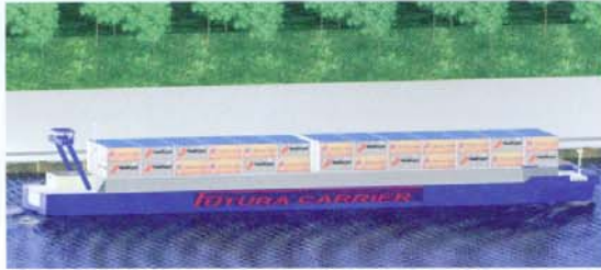
Abb. 4: Container Carrier für kleine Küstenschifffahrt (K20)

stab 1:10, in einem 8 m breiten Kanal, mit 35 cm Wassertiefe untersucht. Das Modell wurde auf einen Tiefgang von 25 cm (unvertrimmt) mit Stahlgewichten abgeladen.