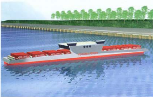
Abb. 3: Simulation des Einsatzes einer 120 m- Futura Carrier Fähre